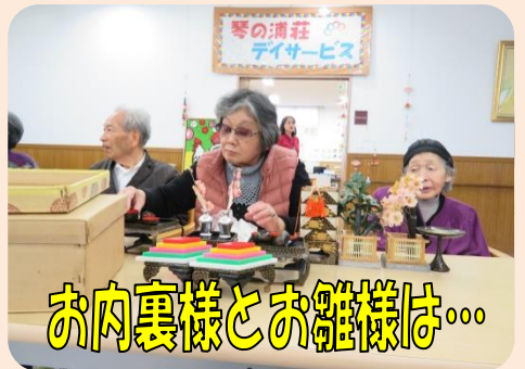
お肉裏様とお雛様は...