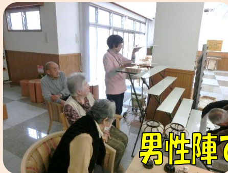
男性陣で骨組から！