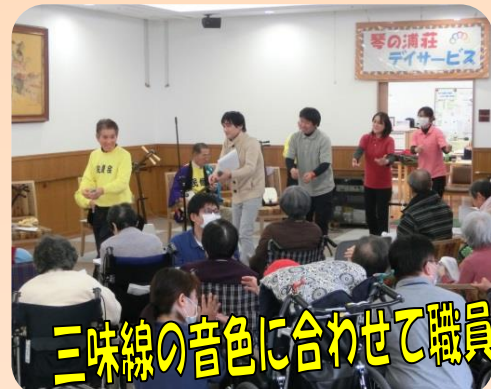
三味線の音色に合わせて職員も踊りました