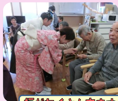
福がたくさん来ますようにと願いを込めて・・・