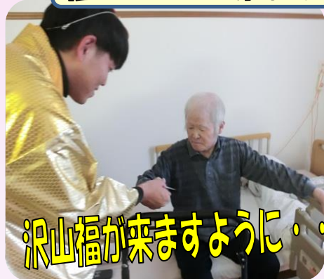
沢山福が来ますように・・・