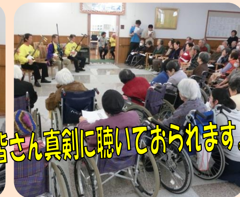
皆さん真剣に聴いておられます。