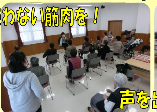
声を出して元気よく！