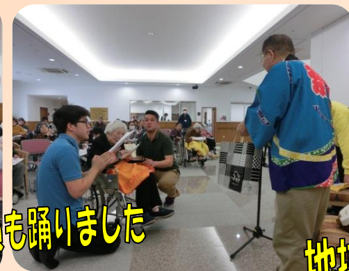
地域の方たちも手拍子