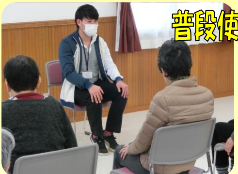
普段使わない筋肉を！