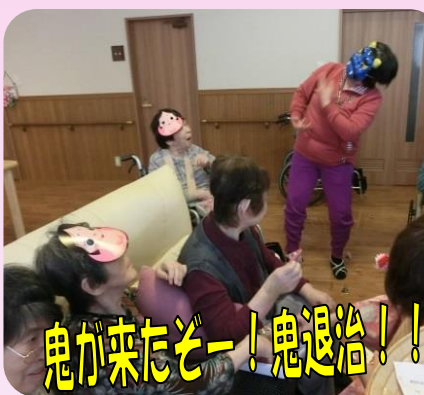
鬼が来たぞー！鬼退治！！