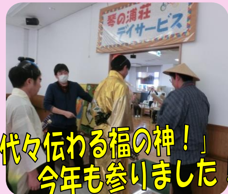
「代々伝わる福の神！」 今年も参りました！