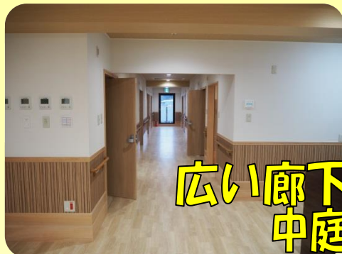
広い廊下に 中庭もあります！