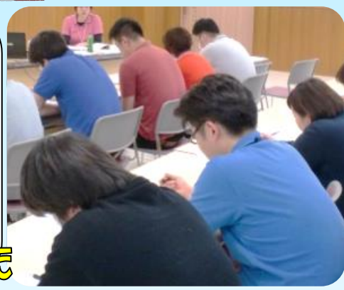
スライドを使って 分かりやすい説明でした

今月は看取りケア研修という内容で施設の看護師が研修を行いました。看取りまでの流れや開始してからの注意点など、参加した職員は真剣な表情で研修に取り組んでいました。看護師はじめ、他職種の参加で活発な意見交換を行い、今後の看取りケアについて考えるいい機会になりました。