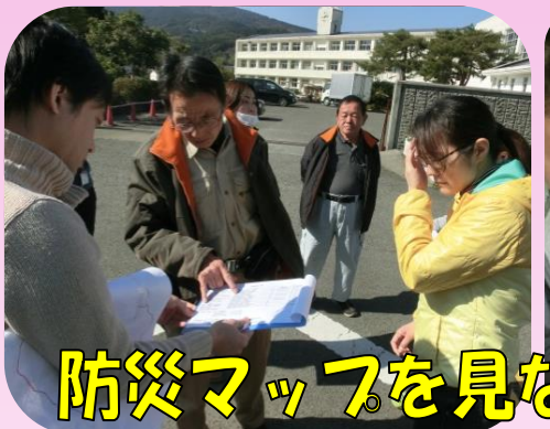
防災マップを見ながら